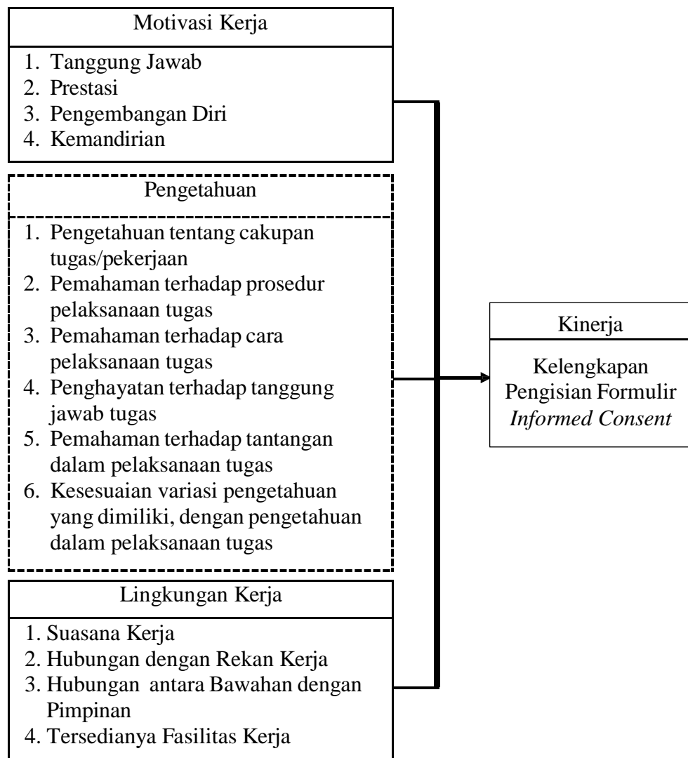
Gambar 3.1 Kerangka Konseptual