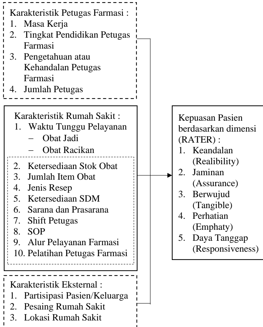
Gambar 3. 1 Kerangka Konseptual Penelitian