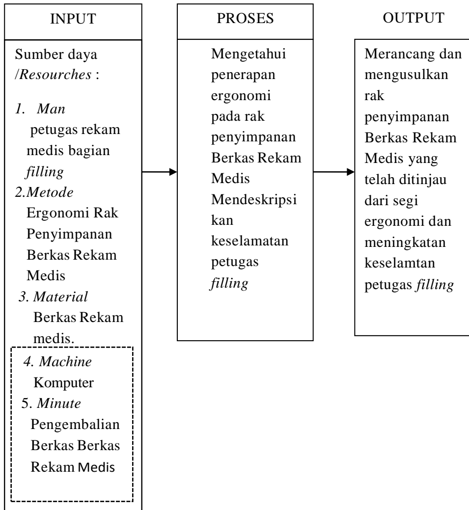
Gambar 3. 1 Kerangka Konseptual