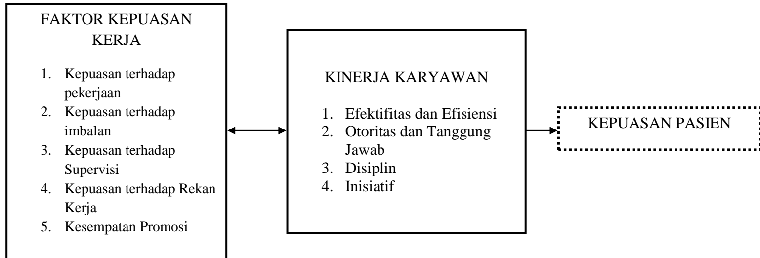
Gambar 3. 1 Kerangka Konseptual